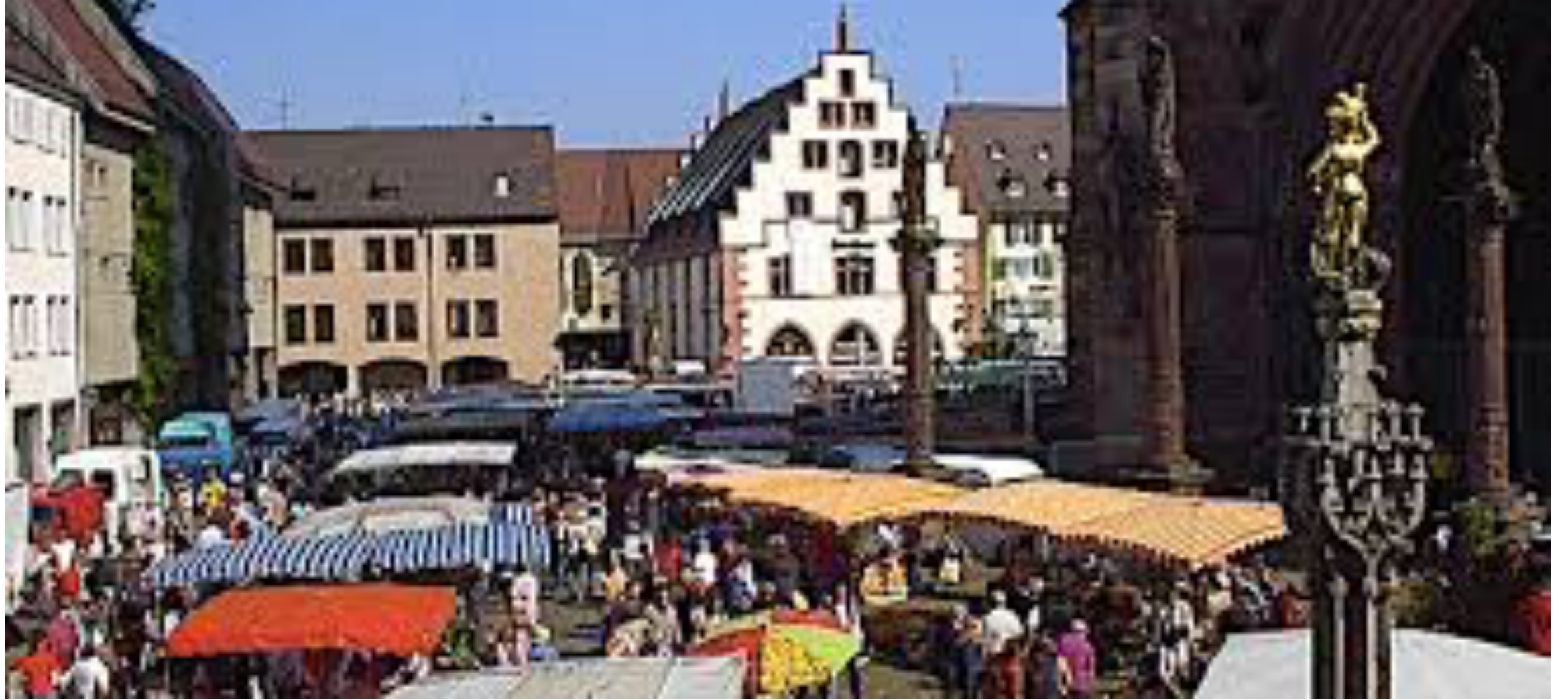
Le marché autour de la cathédrale